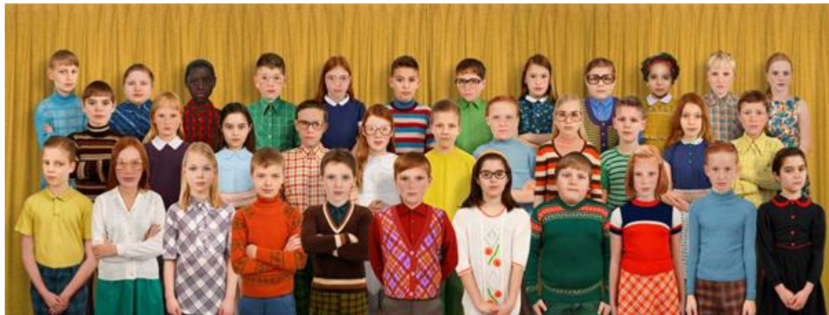
Ruud van Empel, Generation #3, 2011,

Leernetwerk Thematisch Onderwijs Bewust Kiezen