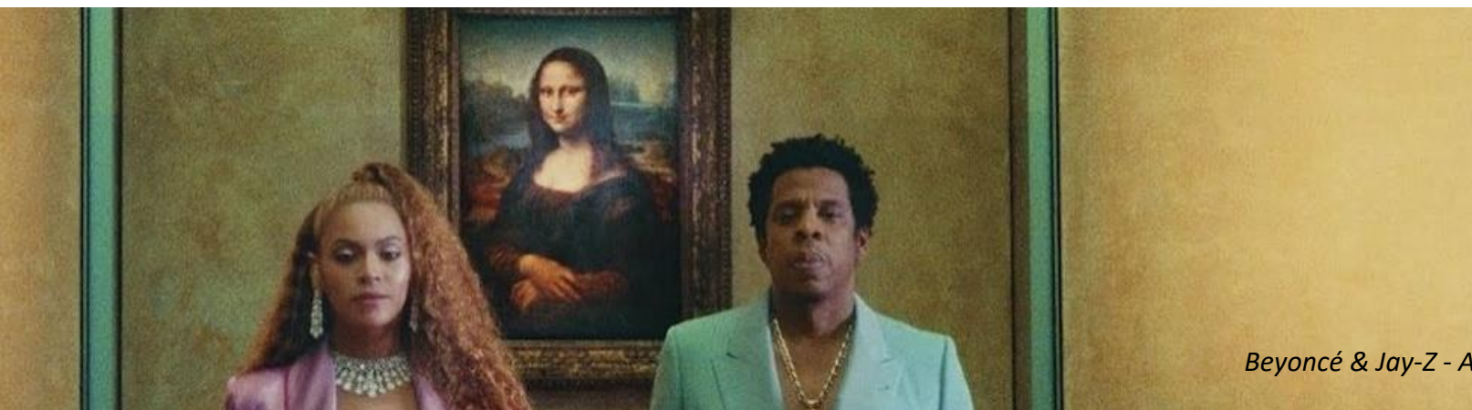
Beyoncé & Jay-Z - Apesh*t, 2018 videoclip opgenomen in het Louvre Parijs