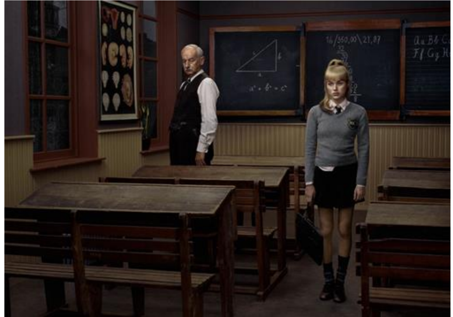
Erwin Olaf Title: Hope, the classroom , 2005