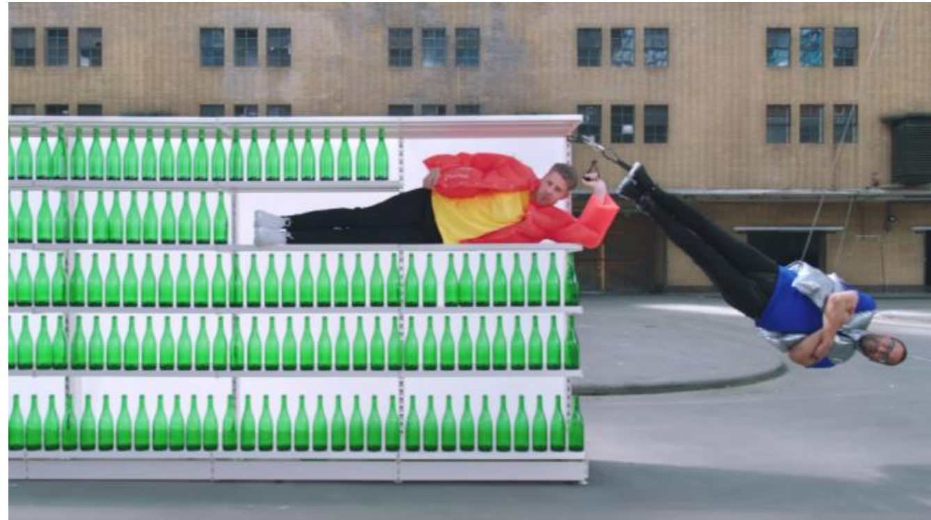
de jeugd van tegenwoordig - Glasbak