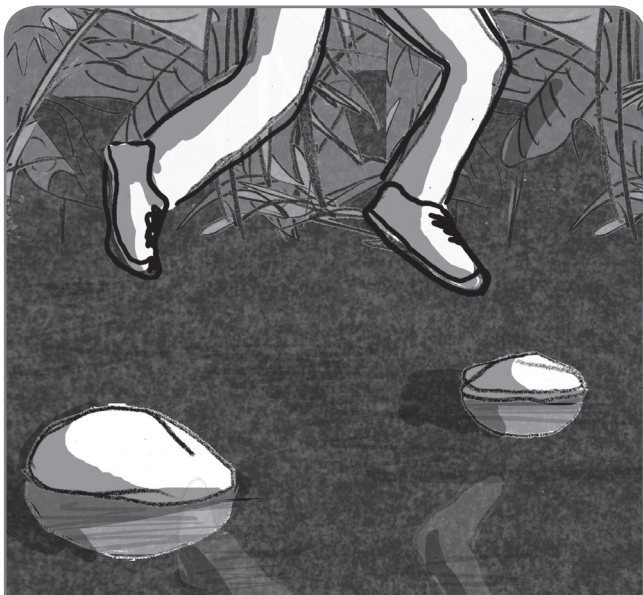
van steen naar steen