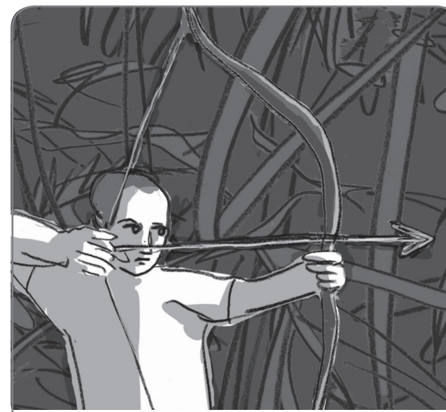
pijl en boog