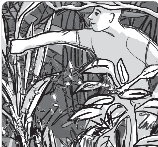
door de bosjes