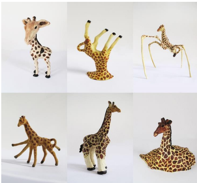
Mijn giraffen verzameling Gerjanne van Zuilen